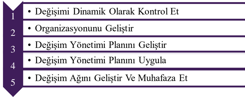
Şekil 1. Değişim Yönetim Süresi

Sağlık Bilimleri Fakültesi, ulusal hedefleri ve paydaş beklentilerini dikkate alarak Fakültede eğitim gören öğrencilerinin geleceğe hazır olmasını sağlayan çevik yönetim yetkinliği benimsenmektedir. Birimde değişim yönetim süreci 5 aşamada gerçekleştirilmektedir (Şekil 1), (Kanıt A.1.3.1.; Kanıt A.1.3.2.; Kanıt A.1.3.3.; Kanıt A.1.3.4). Bu kapsamda PUKÖ kayıt formları ve düzeltici faaliyet uygulamaları doğrultusunda süreçler izlenilmekte birimde PUKÖ döngüsü kurumsal dönüşüm kapasitesi süreçlerinde önemli uygulamalarından birisidir. Bu süreçlerde paydaş toplantıları gerçekleştirilerek stratejik plan ve amaçlar doğrultusunda faaliyetler gerçekleştirilmektedir.