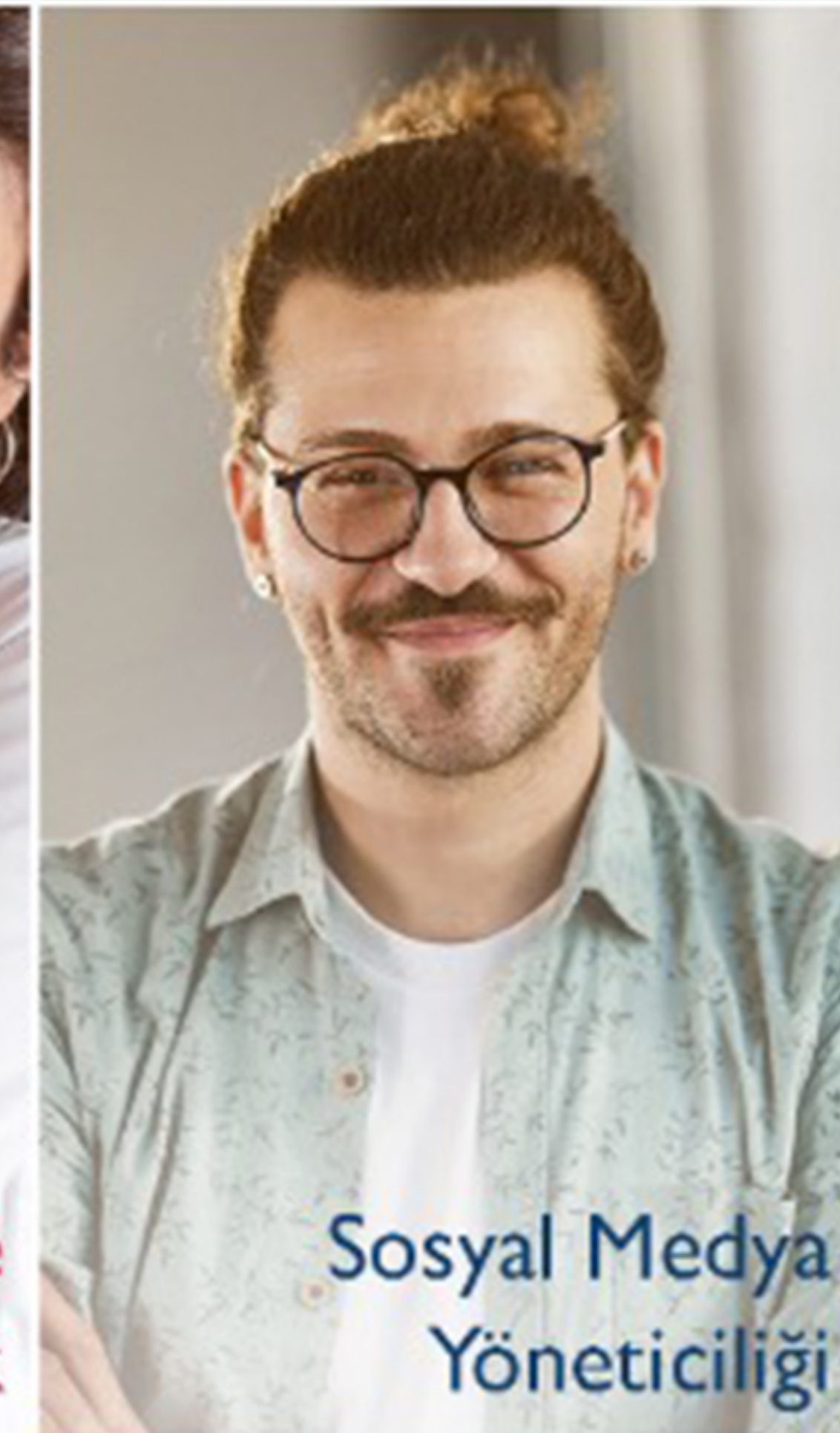
Sosyal Medya Yöneticiliği