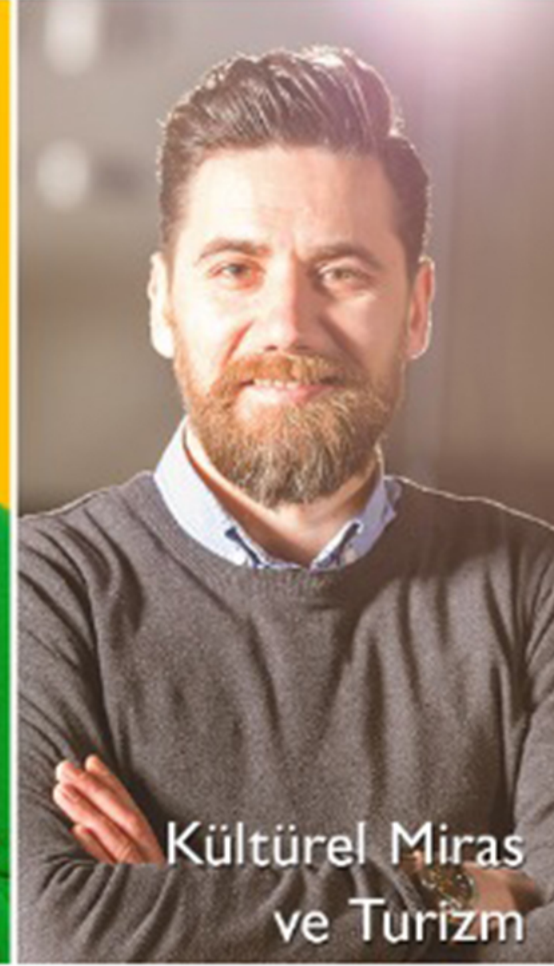
Kültürel Miras ve Turizm