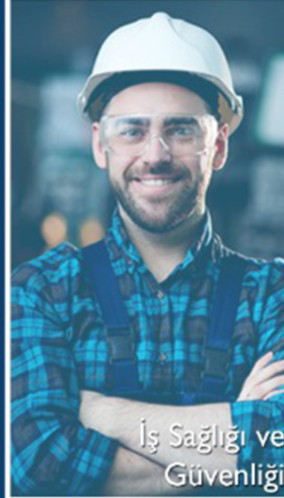
İş Sağlığı ve Güvenliği